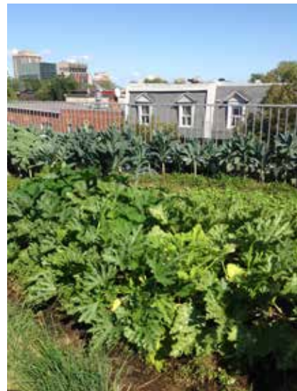
À gauche : Cabanon recouvert de végétation à Haarlem aux Pays-Bas, décembre 2019. À droite : Un potager en culture intensive de 125 m 2 a été aménagé en 2011 sur le Santropol Roulant à Montréal. La nourriture qu'on y fait pousser sert à alimenter le service de Popote Roulante qui prépare une centaine de repas par jour pour les personnes en perte d'autonomie. Les résidus organiques sont compostés à l'aide de vers au sous-sol et le compost est redistribué sur le toit.