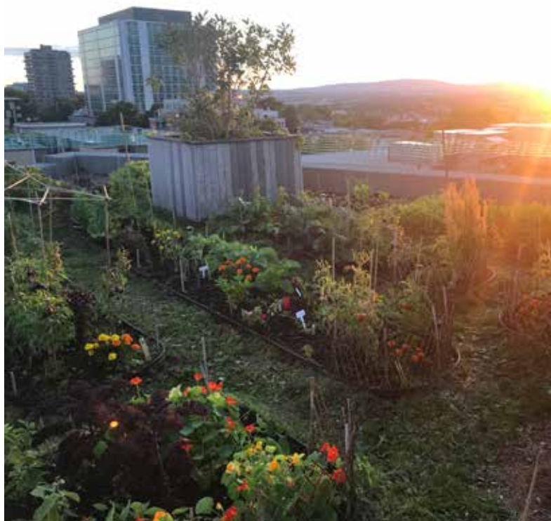
Toiture végétalisée intensive au soleil couchant sur le bâtiment Frédéric Back à Québec, août 2019

Selon le type de culture qui sera installé sur le toit, on peut également ajouter un matelas capillaire sous le substrat de croissance afin de stocker une partie de l'eau et uniformiser la distribution de celle-ci dans le substrat. L'épaisseur du substrat variera entre 10 et 30 cm selon le type de végétaux qui seront cultivés.