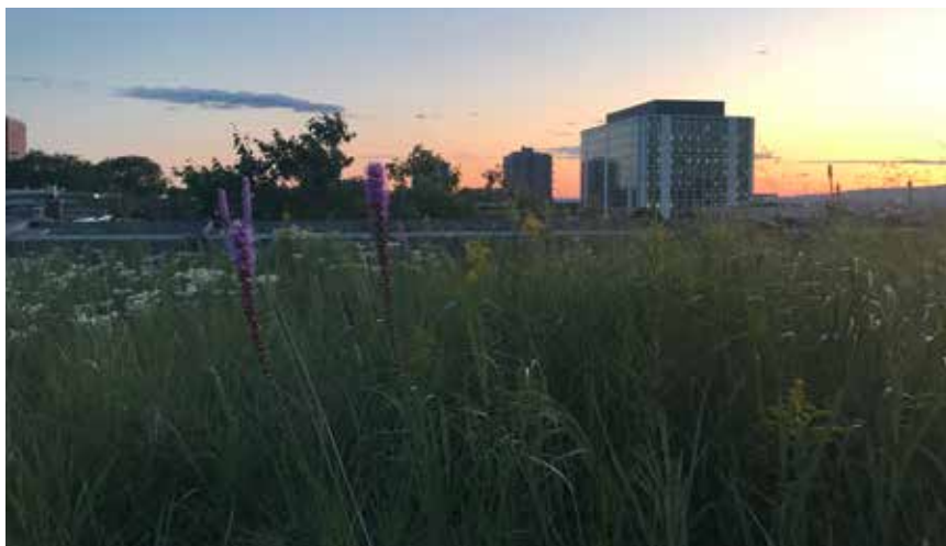
Toiture végétalisée intensive au soleil couchant sur le Centre culture et environnement Frédéric Back dans la haute ville de Québec, août 2019. Aménagée en 2003 lors de travaux de réfection majeurs sur un bâtiment de 1930, la toiture a été conçue pour retenir 80 % des précipitations et les 20 % restants sont recueillis par un drain central et entreposés dans des bassins de rétention pour arroser les espaces verts en période de sécheresse.