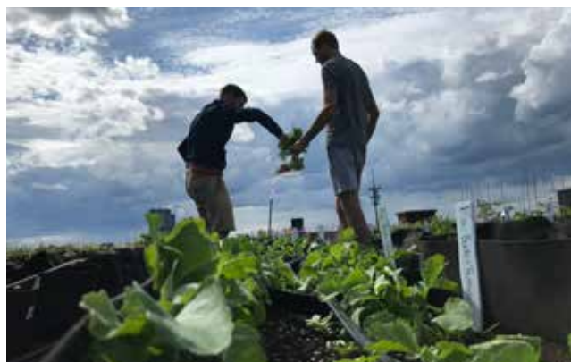
Abondante récolte de radis dans les pots fertilisés au fumier d'insectes lors d'essais de croissance réalisés par TriCycle dans des pots de géotextile sur le toit de La Centrale Agricole, juin 2020

Le principal facteur qui affecte la capacité de rétention de l'eau de pluie par une toiture n'est pas le type de plante, mais bien l'épaisseur du substrat. Sur une base annuelle, un toit vert extensif pourrait réduire le ruissellement de 27 à 81 %, tandis qu'un toit vert intensif atteindrait 65 à 85 % d'efficacité 2 . Une partie de l'eau qui tombe sur le toit sera perdue vers l'atmosphère par évapotranspiration. Le reste de l'eau finira éventuellement dans le système d'égout pluvial, mais cet écoulement sera beaucoup moins volumineux, et se produira plusieurs heures, voire quelques jours, après la pluie, ce qui évite de surcharger le réseau, et diminue les risques de surverses d'eaux contaminées vers les cours d'eau.