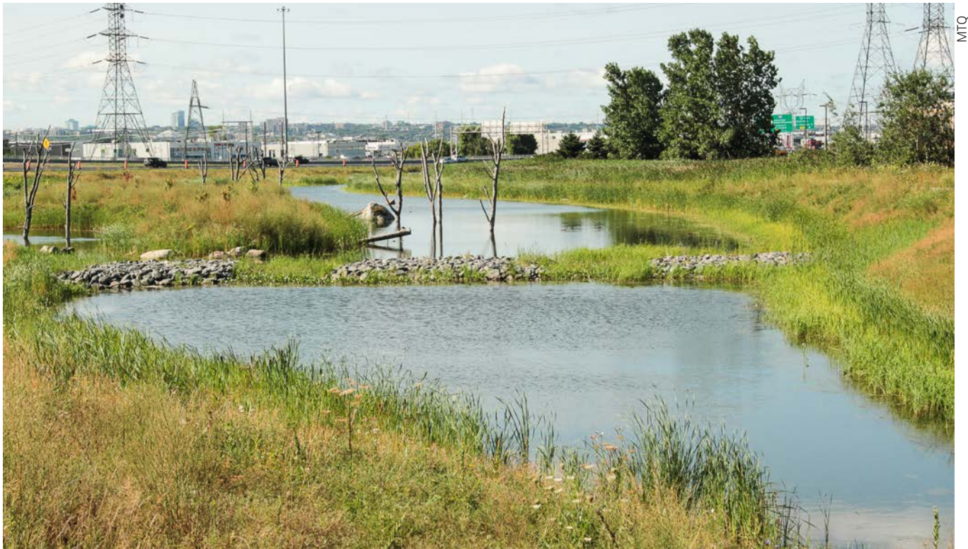
Figure 3. Au premier plan : cellule de prédécantation située en amont du bassin de rétention de l'échangeur des autoroutes 40 et 73 situé dans la ville de Québec. Au second plan : vue d'ensemble du bassin de rétention.

La pression d'invasion par la végétation demeure néanmoins présente sur la périphérie exondée et les secteurs peu profonds du bassin. Des espèces aquatiques (p. ex. : Pontederia cordata , Sagittaria latifolia ) et riveraines (p. ex. : Alnus incana ssp. rugosa , Cornus stolonifera ) qui occupent les habitats recherchés par le roseau ont été implantées pour former un cortège floristique compétitif dans ces zones vulnérables. Des espèces terrestres choisies en fonction de leur résistance aux embruns salins (p. ex. : Rhus typhina , Alnus viridis ssp. crispa ) contribuent elles aussi à limiter l'espace disponible pour le roseau. Ces plantations ont été conçues pour évoluer de façon naturelle sans intervention particulière au-delà de la période d'entretien prévue au contrat de construction.