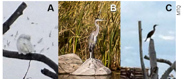
Figure 4. Exemple d'espèces aviaires observées dans le bassin de l'échangeur des autoroutes 40 et 73 situé dans la ville de Québec; A) harfang des neiges ( Bubo scandiacus ) perché sur un chicot; b) grand héron ( Ardea herodias ); c) cormoran à aigrettes ( Phalacrocorax auritus ) perché sur un chicot.

Ces derniers sont les bénéfices retirés des fonctions des écosystèmes par la population humaine (De Groot et collab., 2002). Les services de régulation (modération ou régulation des phénomènes naturels), d'approvisionnement (production de biens tangibles), de support (maintien des conditions de base au développement de la vie) et socioculturels (production de biens intangibles, récréatifs, éducatifs ou esthétiques) sont parmi les plus cités (Limoges, 2009; Millennium Ecosystem Assessment, 2005; MDDEP, 2012). Les services de régulation,