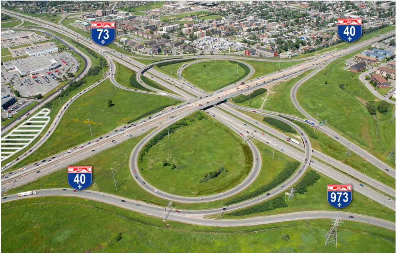
Figure 1. État des lieux de l'échangeur des autoroutes 40 et 73 situé dans la ville de Québec avant le réaménagement débuté en 2014. Malgré sa grande superficie, le site n'abrite aucun milieu naturel d'intérêt. Zone hachurée (en blanc, tout à gauche): secteur colonisé par le roseau commun.

entraînent une diminution des processus d'évapotranspiration et d'infiltration des eaux de pluie. Ce phénomène accroît les taux de ruissellement et provoque la hausse des débits dans les réseaux de drainage et dans les cours d'eau récepteurs où sont susceptibles de croître les risques de débordement, d'érosion et de contamination (Gouvernement du Québec, 2012).